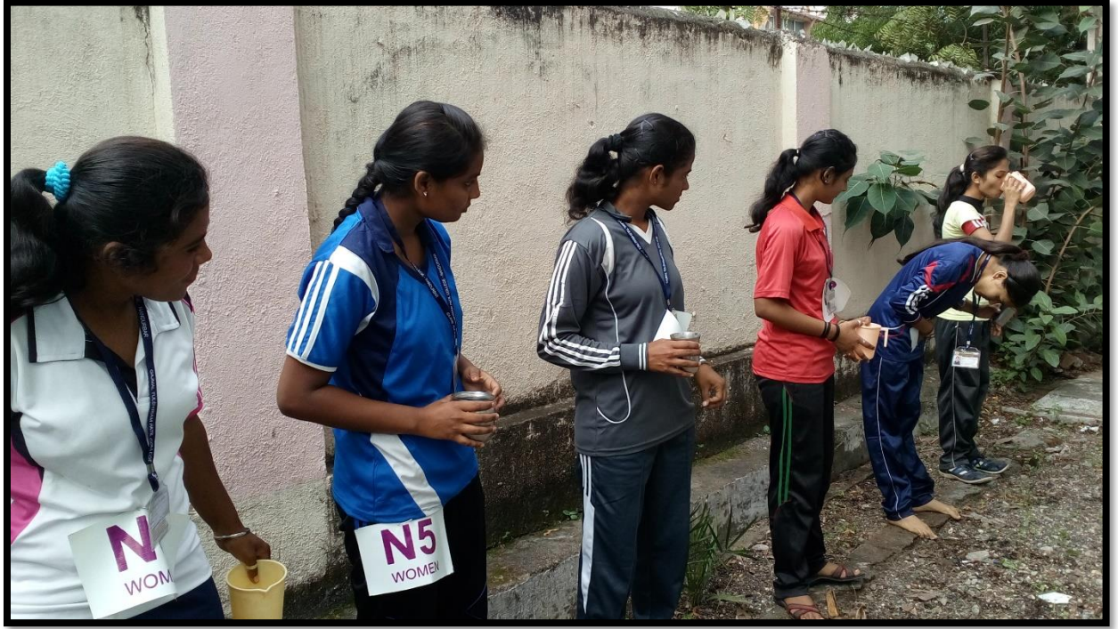
College Yoga Players were performing Jalneti Kreeya (जलनेती क्रिया) at University level women competition on 22/09/2017