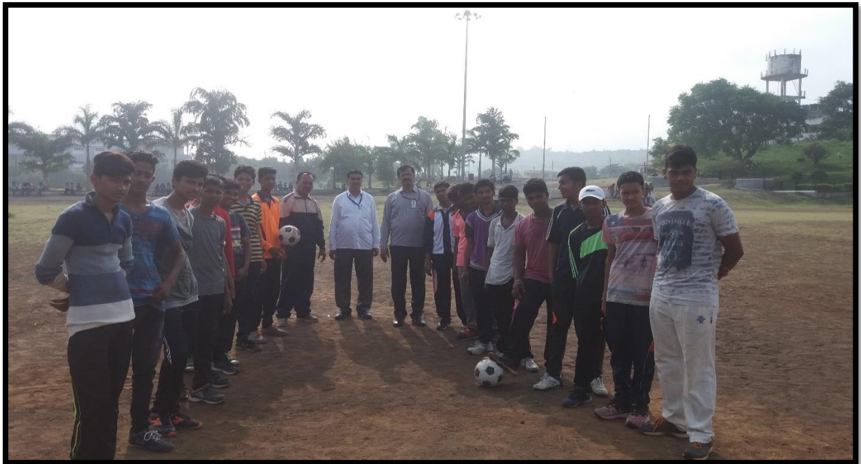
Football Promotion Activity at College level on 15/09/2017 (On the Occasion of FIFA Under 17 world cup gone to be organized in INDIA)