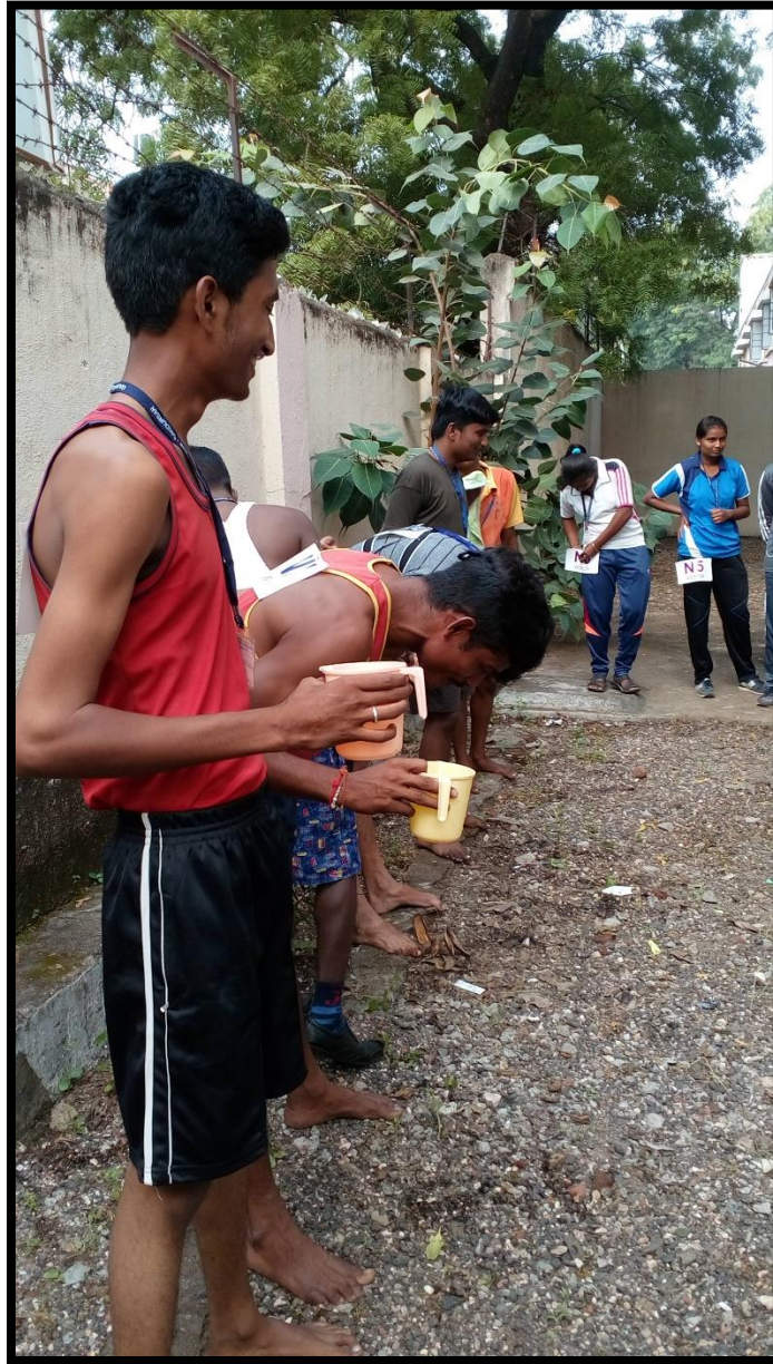
Mens Waman Competition on 22/09/2017